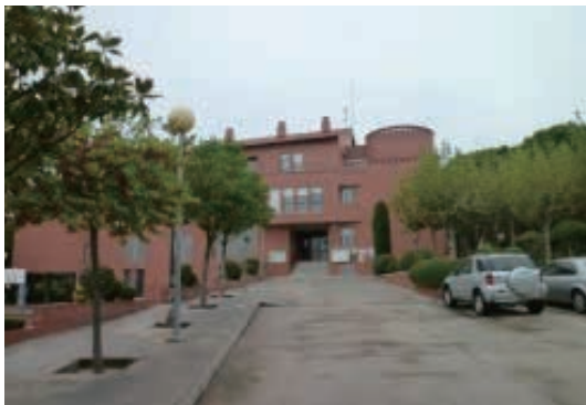
コンセルタード校舎

幼稚園と小学校が併設された公立学校。3才児から小学6年まで各学年2学級ずつで編成される。地域的に教育への関心が高い保護者が多く、補習学習（スペイン語や各教科学習について、習得の遅れが見られる児童対象）や特別支援教育の充実（自閉的傾向の児童の受け入れ）を学校独自で行っている。