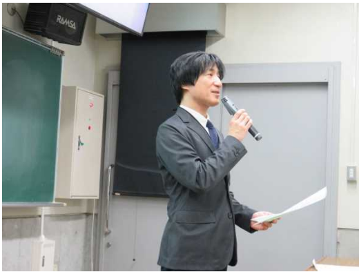
馬場センター長の挨拶