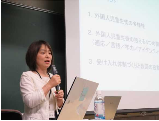
第1回見世准教授 講義1